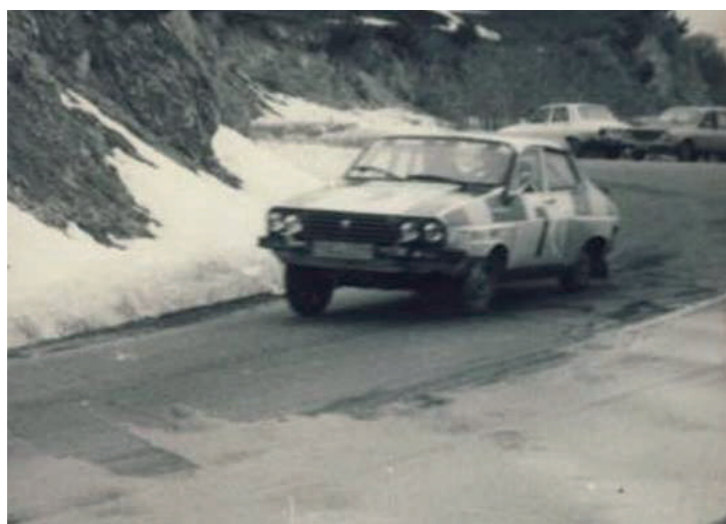
1989, Secvență de pe Proba Specială „Poiana Brașov” 1989, Sequence from the ”Poiana Brașov” Special Stage

Upon becoming a part of the national sports calendar, the Brasov Rally rapidly gained recognition and became a part of international competitions that crossed Romania: the Romanian Rally and the Balkan Rally .