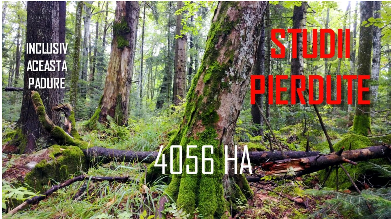
Imaginea 2: o pădure din Carpații Orientali, avizată pozitiv de Garda Forestieră și trimisă Ministerului unde a dispărut din gestiune.

Oficialii responsabili au eșuat lamentabil în rolurile lor de a proteja pădurile cele mai valoroase cu potențial de a intra în Catalogul Național.