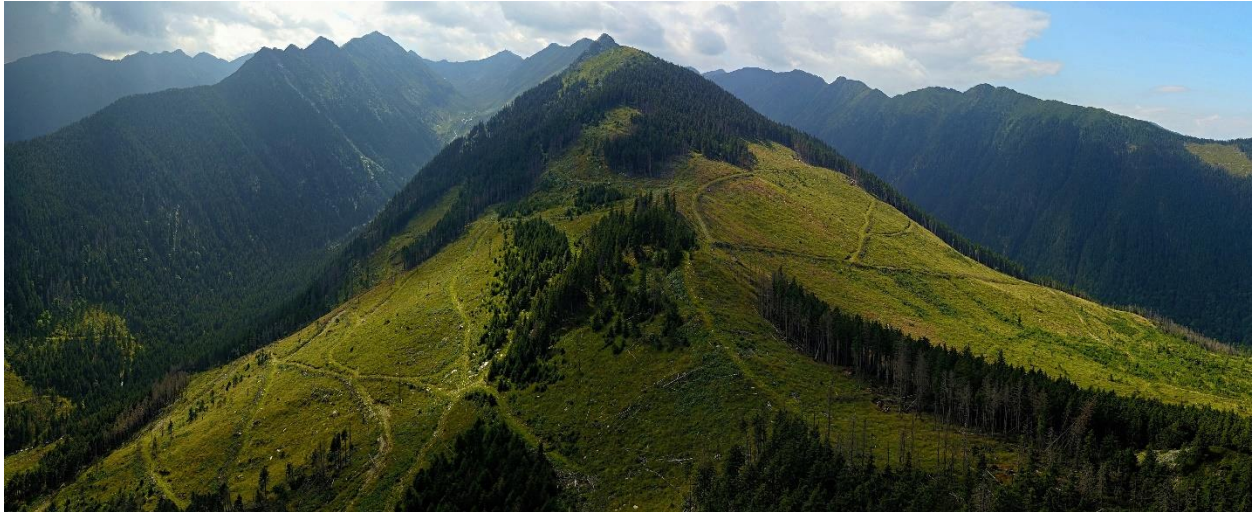
Imaginea 5: Tăieri la massive la ras în foste păduri primare și seculare. Valea Ucea, Munții Făgăraș

7. Există un potențial conflict de interese în cadrul Ministerului, în special în Comisia Tehnică de Avizare pentru Silvicultură (CTAS), agenția care aprobă totodată planurile de exploatare.