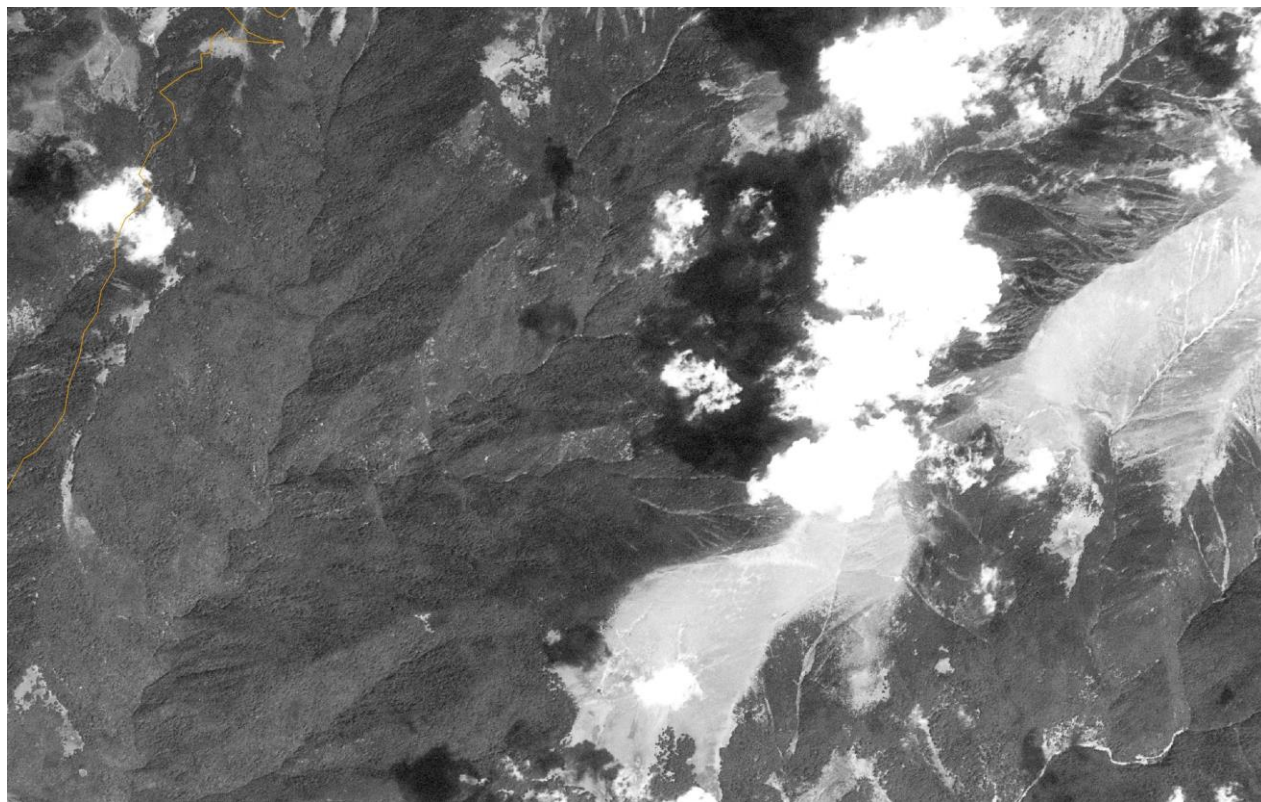
Imaginea 3: Imagine satelitară a văii Boia Mică din 1969 care arată o zonă naturală fără semne de intervenție umană. Cu toate acestea, Garda Forestieră Vâlcea a susținut că aceste păduri au fost parțial exploatate în trecut și, prin urmare, nu sunt „păduri virgine”.

Acestă confuzie, în care Ministerul și Garda Forestieră au comunicat informații în mod clar conflictuale, stă la baza întrebării critice cu privire la calitatea administrației publice și la nivelul profesionalismului de la Ministerul Mediului în îndeplinirea îndatoririlor lor, așa cum este prevăzut de lege. Cazul Boia Mică ridică îndoieli serioase cu privire la intenția Guvernului Român de a proteja cele mai importante păduri ale României.