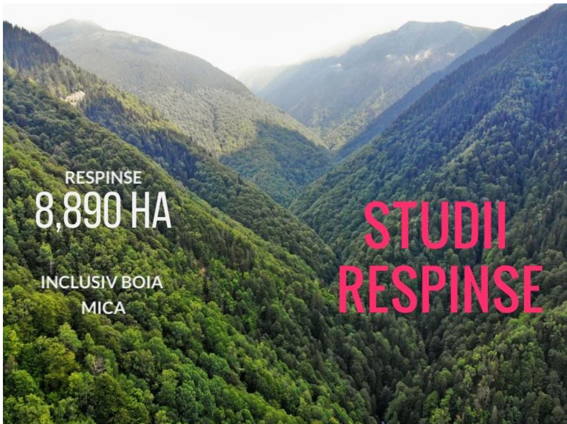
Imaginea 4: Peste 1000 de hectare de păduri intacte primare din Valea Boia Mică, Munții Făgăraș.