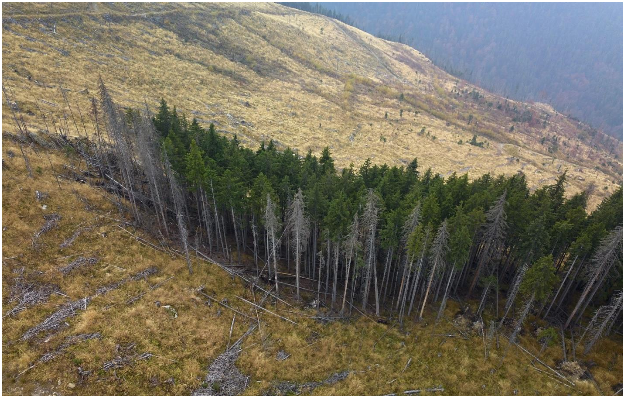
Imaginea 6: Tăieri la massive la ras în foste păduri primare și seculare. Valea Ucea, Munții Făgăraș